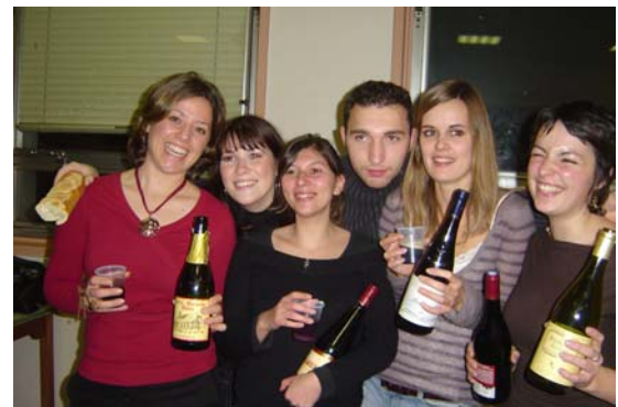
La commission Carpe Diem