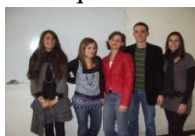
Voici les futurs DRH à dominante sciences humaines