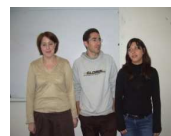
Puis voila les juristes